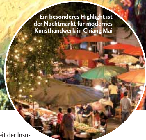
Ein besonderes Highlight ist der Nachtmarkt für modernes Kunsthandwerk in Chiang Mai