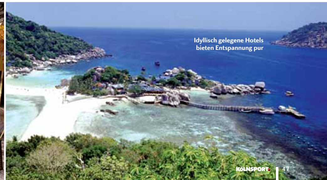
Idyllisch gelegene Hotels bieten Entspannung pur