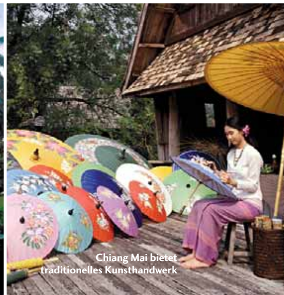
Chiang Mai bietet traditionelles Kunsthandwerk