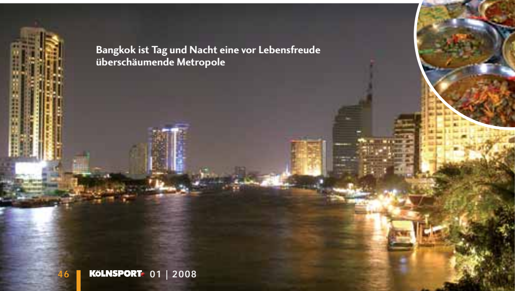
Bangkok ist Tag und Nacht eine vor Lebensfreude überschäumende Metropole

Die beste Reisezeit ist unser Winterhalbjahr von November bis April, dann ist es dort bis 35 Grad warm und trocken. In andere Halbjahr fallen je nach Region verschiedene Regenzeiten, die man in die Planung der Reise einbeziehen sollte.