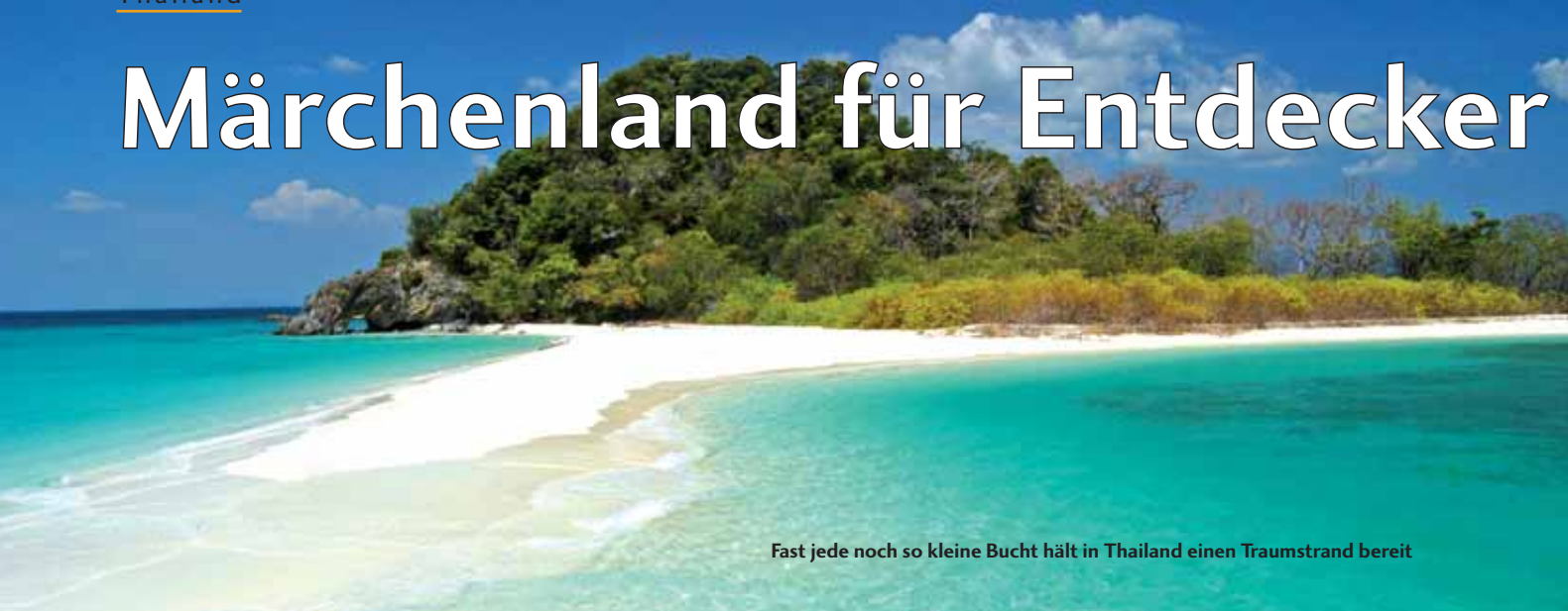
Fast jede noch so kleine Bucht hält in Thailand einen Traumstrand bereit