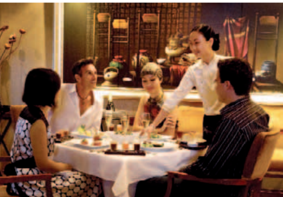
Edle Speisen und Top-Service gibt's im Restaurant „Reflections“