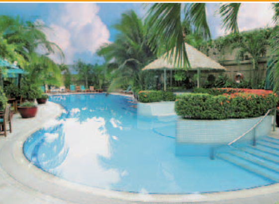
Ein Traum auf dem Hoteldach: der Swimming Pool