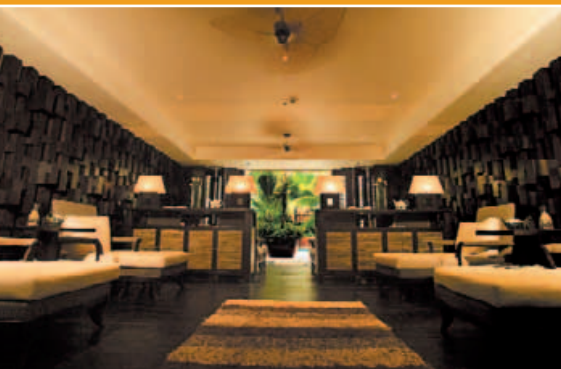
Blick in den großen Spa-Bereich des Hotels