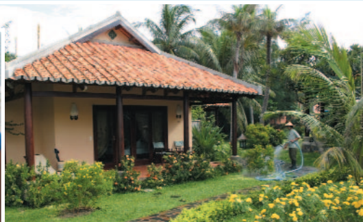
Vietnamesischer Baustil mit westlichem Komfort