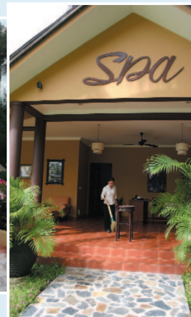
Eingang zum Spa-Bereich