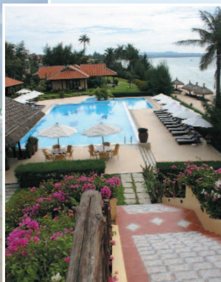
Links der Pool, rechts der Ozean